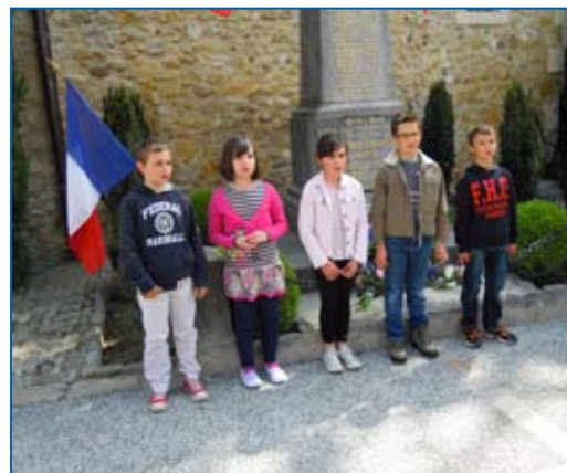
Les enfants de l'école participent aux cérémonies du 8 Mai et 11 Novembre.

Achats de meubles dans le bureau, imprimante couleur à la maternelle, meuble de rangement pour la maternelle.